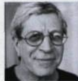
GÉRALD LEBLANC Poèmes New-Yorkais Perce-Neige