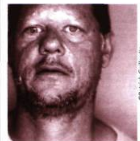
William T. Vollmann