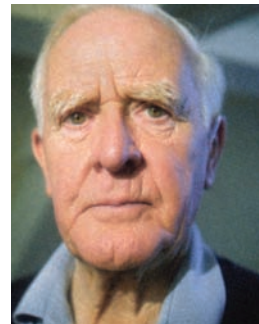
John le Carré

Les amateurs de frissons et d'intrigues seront servis avec le nouveau thriller de Kathy Reichs, Autopsies (Robert Laffont). L'anthropologue judiciaire Temperance Brennan se trouve dans une position, disons, inconfortable : que fait-elle ligotée dans cette pièce petite et froide ? Pourquoi ne se souvient-elle de rien ?