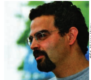
Gonçalo M. Tavares