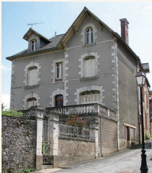
Maison familiale de Julien Gracq à Saint-Florent-le-Vieil