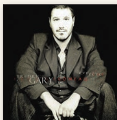
Album Ève rêve

La poésie de Fredric Gary Comeau tient dans sa capacité à créer des atmosphères : une émotion, un souvenir, un fait, un désir et, de là, le texte se construit. Ses poèmes se nourrissent de sa vie affective, que ce soit l'amour, l'amitié, la relation avec l'autre, et même avec ce que l'on pourrait appeler le monde puisque plusieurs des textes rappellent ses nombreux voyages. Une brume enveloppe les poèmes, ce qui leur donne paradoxalement une luminosité, une transparence émotive qui nous permet de saisir ce qu'ils cherchent à nous faire partager.