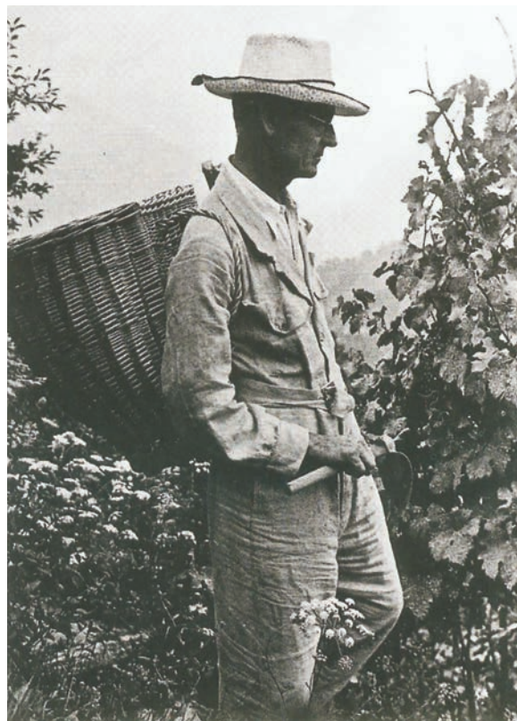
Hermann Hesse, dans le jardin de la casa Bodmer

grands romans et de nouvelles. Mais toute sa vie il a écrit de la poésie. S'y ajoutent d'innombrables comptes rendus, articles de journaux et une très riche correspondance avec sa famille, ses épouses successives, ses deux fils, ses amis, éditeurs, confrères dont Max Brod, Thomas Mann, André Gide – qui l'admirait et préfaça Le voyage en Orient . Écrire était pour lui la vocation impérieuse, il ne s'y est jamais dérobé, il lui a tout sacrifié.