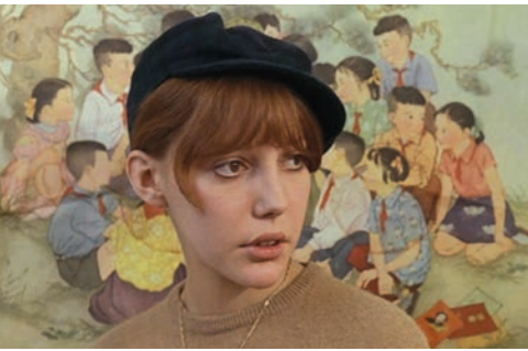
Anne Wiazemsky dans La Chinoise de Jean-Luc Godard

liaison avec l'auteur d' À bout de souffle depuis les événements de Mai 68 et l'interruption du Festival de Cannes jusqu'au tournage de One + One et ses collaborations avec les cinéastes Bertolucci et Ferreri.