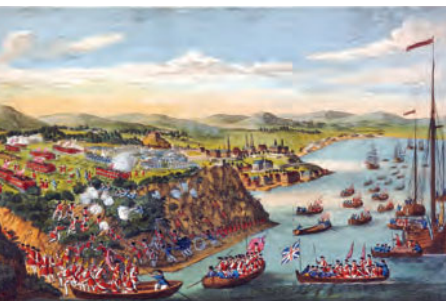
Bibliothèque et Archives Canada