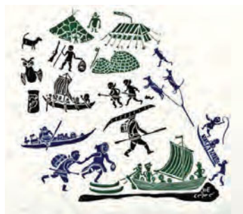
Détail de la couverture