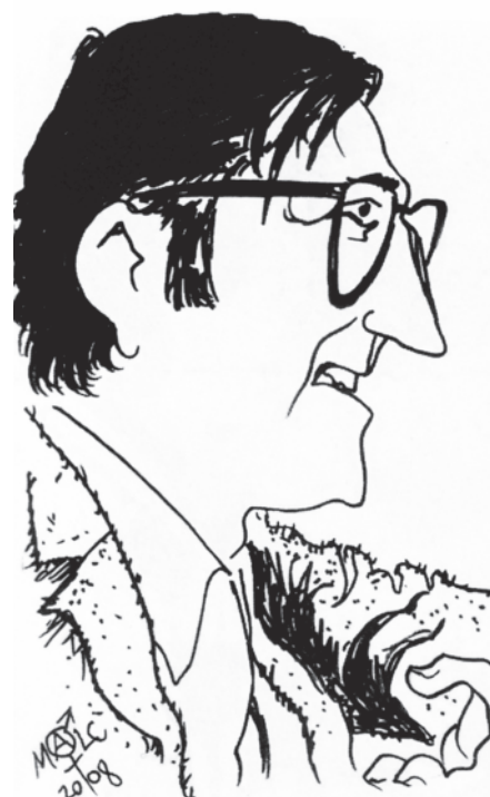
Miron par Malcolm Reid