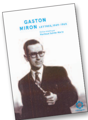
Gaston Miron à Montréal vers 1950