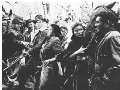
Pour qui sonne le glas (1943) d'après Hemingway

Le récit refait donc la chronique d'un village, qui suit les faits et gestes de quelques personnages représentatifs, ce qui les unit, et ce qui les sépare de plus en plus à mesure que les franquistes gagnent du terrain et que les esprits s'angoissent et se durcissent. Défilent ainsi Joseph (tué dans une absurde escarmouche), Diego, jeune époux de Metse, rigide dans le style commissaire du peuple stalinien et qui sombrera dans