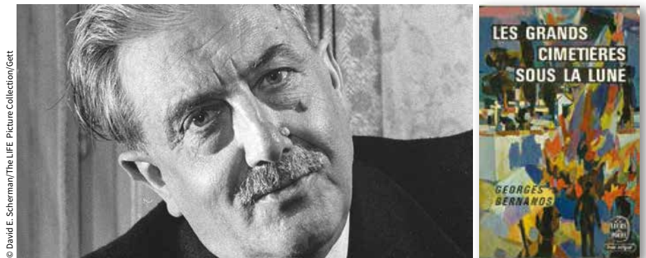
Georges Bernanos en 1946

fournit la liste) cautionnant les tueries et bénissant les canons de Franco et de ses sbires. Bernanos horrifié dénonce les atrocités commises au nom de la croisade antibolchevique. Pour le lecteur d'aujourd'hui qui n'a pas une connaissance précise de la France politique d'avant-guerre, le livre est parfois peu intelligible, bien des références et allusions lui échappent, noyées dans un discours diffus et répétitif. Inlassablement