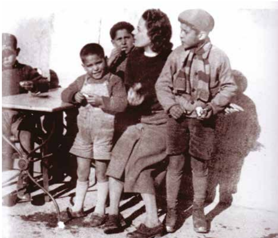
Album Gabrielle Roy, Boreali, 2014. © BAC-figr, NL-19151