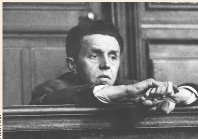
Lucien Rebatet durant son procès pour acte de collaboration en 1946

Les deux étendards , inspiré par des souvenirs de la jeune vingtaine consignés par Rebatet dans son journal, se déroule majoritairement à Lyon dans les années 1920. Le titre est un emprunt aux Exercices spirituels d'Ignace de Loyola, fondateur de la Compagnie de Jésus au XVI e siècle, et réfère à la capacité et à l'effort de chacun de discerner le Bien du Mal, de séparer le bon grain et l'ivraie. Si le personnage de Régis Lanthelme, jeune pianiste doué qui choisit de sacrifier son amour à sa vocation religieuse, ou qui plutôt élève avec lui Anne-Marie qu'il aime dans la communion avec Dieu, Michel Croz, son ami depuis le collège, est en principe tout le contraire. C'est du moins ainsi que se présente d'abord Michel, en qui se projette Rebatet : un anticlérical qui fait des études de philosophie, épris de modernité, mélomane presque fanatique et qui espère consacrer sa vie à la littérature. Mais Michel, fasciné, puis conquis par l'illumination que Régis et Anne-Marie ont partagée une certaine nuit sur une colline isolée et qui prend la forme d'« une double consécration mystique », quitte ses études à Paris pour retrouver ses amis à Lyon et tenter de partager leur quête