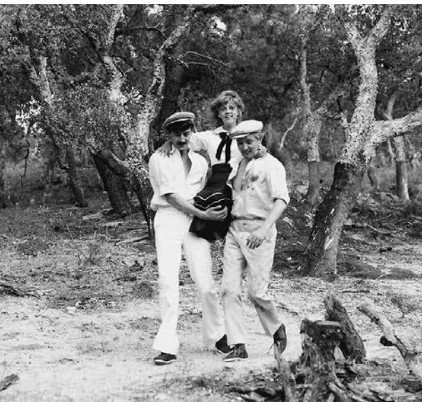
Henri Serre, Jeanne Moreau et Oskar Werner dans Jules et Jim