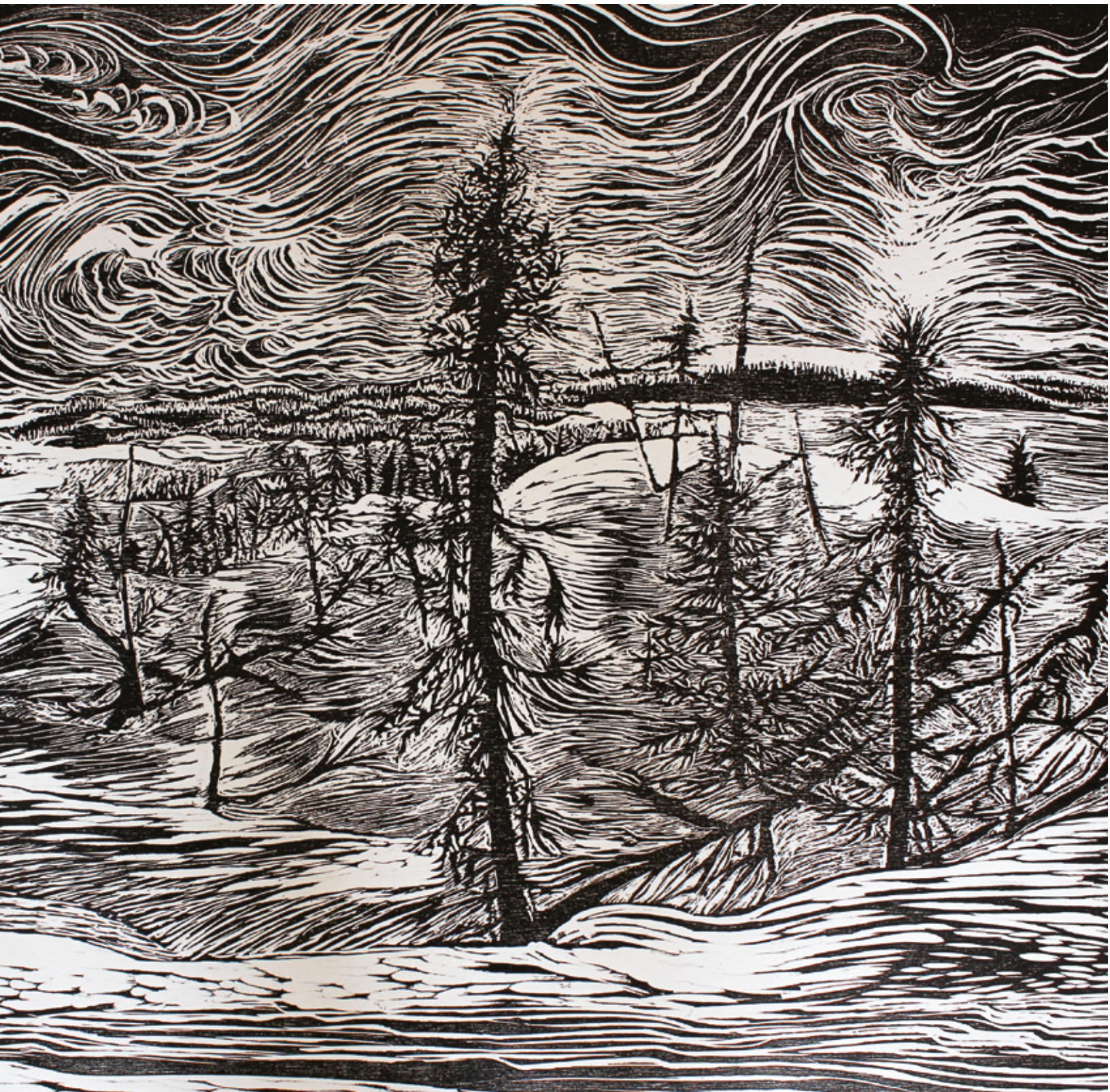
..... Épinettes noires , 2014, gravure de Chantal Harvey – voir p. 36.