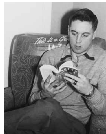
Les éditions Marabout, Bob Morane et le Québec (Septentrion, 2019)