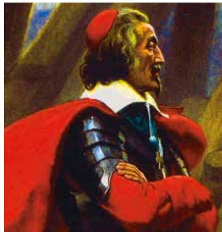
Le cardinal de Richelieu

Le comte de Moret/Le Sphinx rouge , II, 11, p. 244.