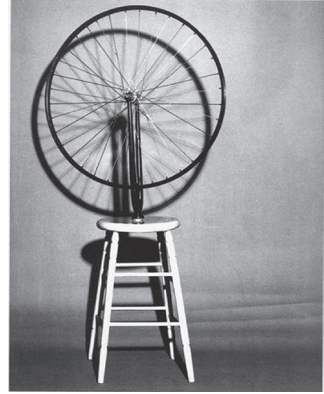
© Marcel Duchamp, Roue de bicyclette 1913

Disons-le nettement : « libre » (ce mot piège) est par l'art troué. L'art libre est libre de l'art (reconnu comme tel), l'art libre est libre du libre (reconnu comme « librisme »), l'art libre est dans les mots une contradiction, il est dans les faits une interdiction, c'est-à-dire un langage qui passe entre, entre nous, qui nous traverse et nous transporte. Peut-être.