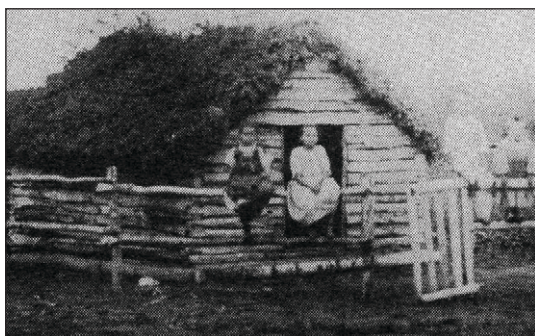
3. Première maison de la famille Bergot.

de premiers pionniers, tantôt bâties de simples rondins et couvertes de branchages ou de tourbe (comme la maison des Bergot originaires de Carquefou en Loire-Atlantique), tantôt entièrement construites de tourbe (comme certaines maisons construites au tout début de la colonisation dans la région de Redvers ou celle de Montmartre), tantôt plus primitives encore et utilisant des dénivellations de terrain ( ill. 3, 4 et 5 ).