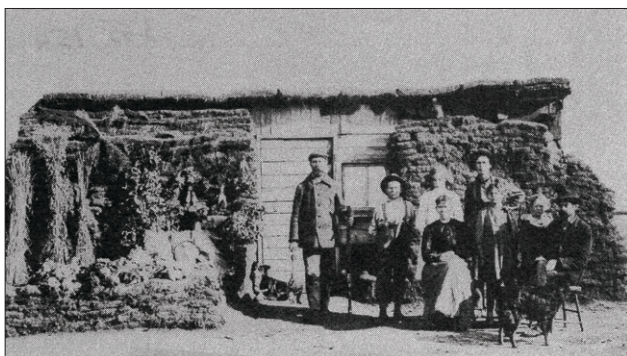
4. Exemple de maison faite de bois et de tourbe (vers 1908 près de Redvers).