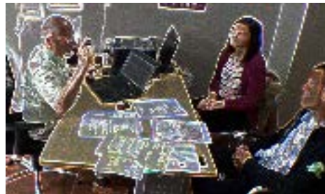
Fig. 1. L. 65, image #1

mais j'ai besoin dit-il car le recours le dit aussi il a besoin que vous disiez les choses avec vos propres mots