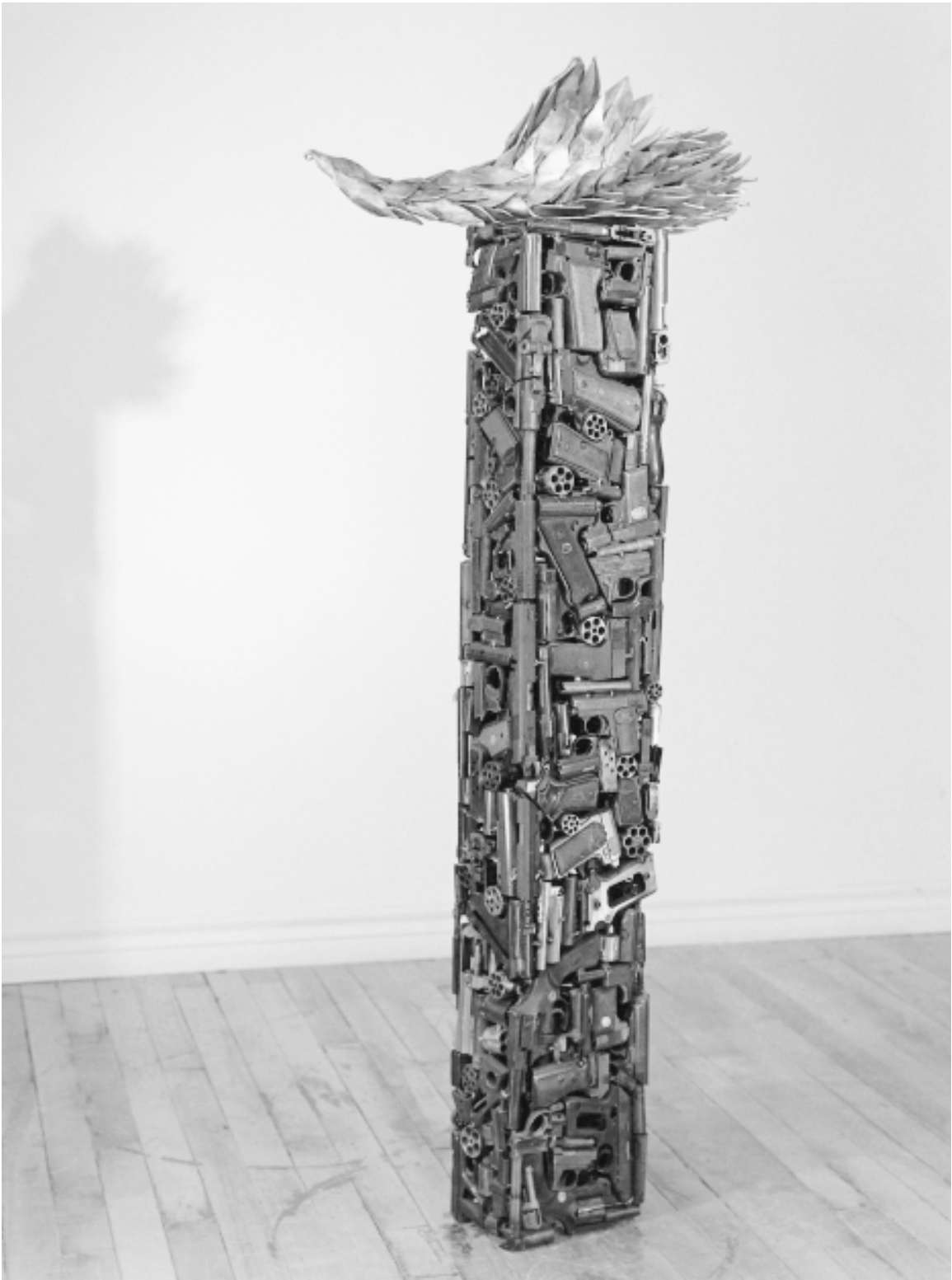
Alex Magrini, Apogée , 2000. Aluminium et fragments d'armes de poing, 30 x 30 x 140 cm.