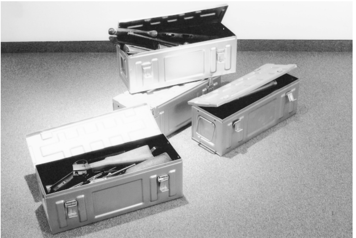
Alex Magrini, Boîtes de Pandore, 1998. Fragments d'armes et acier, 160 x 220 x 50 cm.