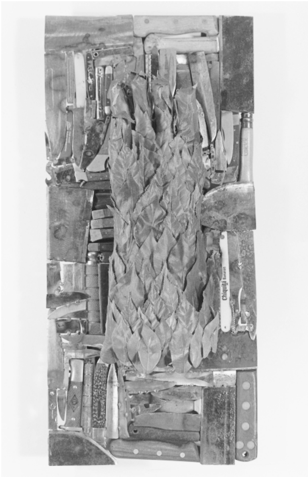
Alex Magrini, Gant de fer, 2001. Fragments d'armes blanches et feuilles synthétiques, 80 x 40 x 10 cm.