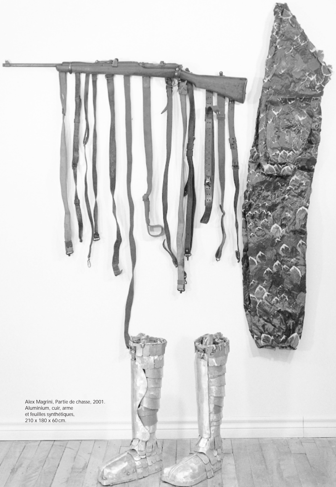
Alex Magrini, Partie de chasse, 2001. Aluminium, cuir, arme et feuilles synthétiques, 210 x 180 x 60 cm.