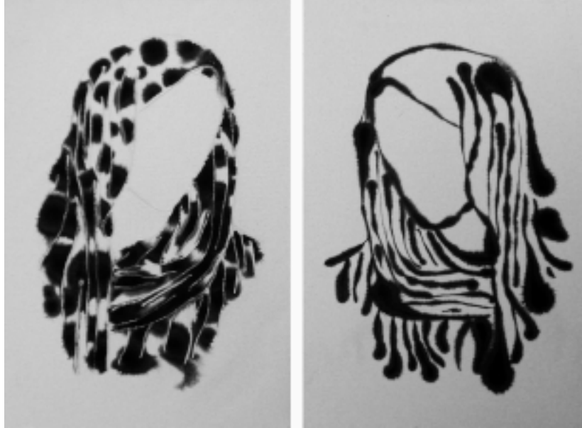
Deux Drapés (diptyque), 2006, 60 x 90 cm (dispersion de pigment sur toile).