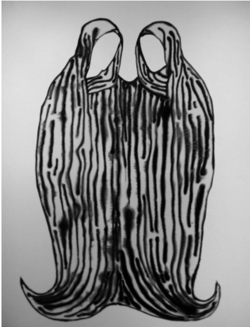
Saintes-Grenouilles , 2007, 213 x 168 cm (acrylique sur toile).