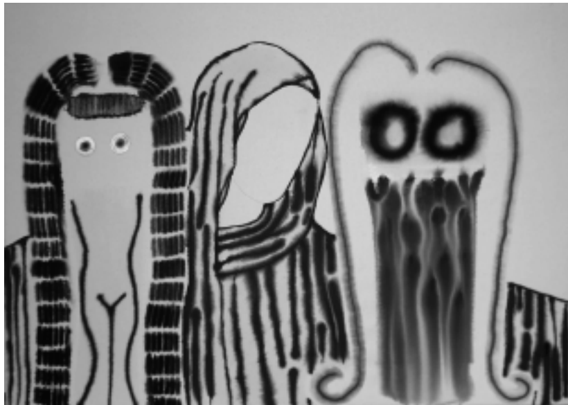
Trinité , 2007, 76 x 107 cm (acrylique sur toile).