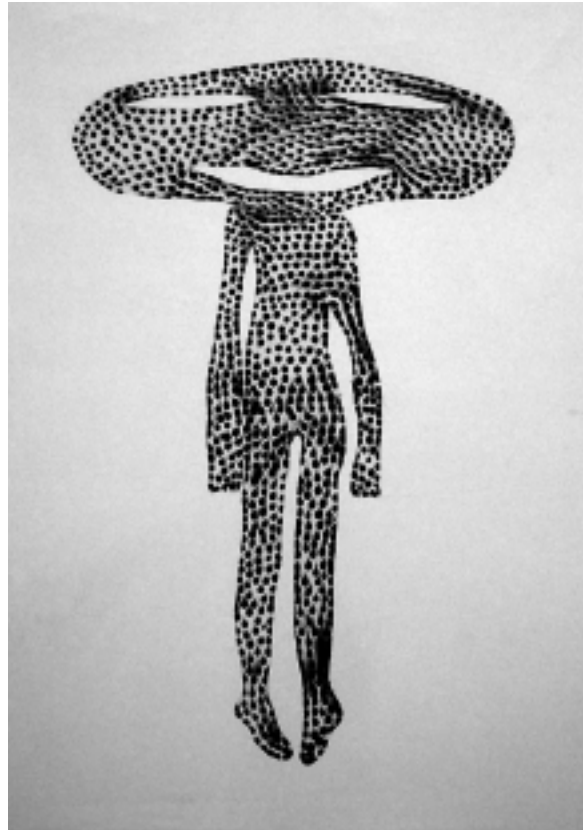
Grand Visage , 2004, 320 x 180 cm (dispersion de pigment sur toile).