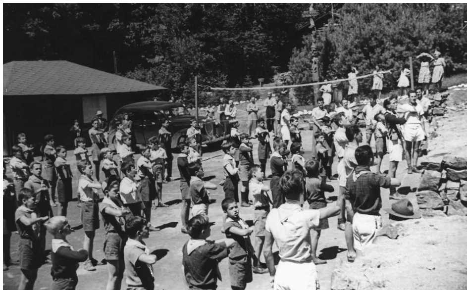
Camp Boscoville, Lac des Français, vers 1944