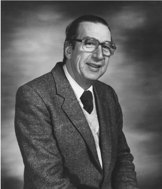
Gilles Gendreau (23 avril 1926 – 20 juin 2010)

Gilles Gendreau n'est plus. L'annonce du décès du « père de la psychoéducation » – décès survenu singulièrement le jour de la fête des pères – en a bouleversé plusieurs. Gilles était devenu un personnage quasi intemporel : pour les plus aguerris, il était un collègue, pour les plus jeunes, une figure légendaire de l'histoire de la psychoéducation. Vivre à la même époque que le fondateur d'une discipline est un honneur rare ; tous ceux qui l'ont côtoyé de près, collègues, étudiants, jeunes en difficulté, peuvent se compter privilégiés. Permettez-moi un parallèle : Gilles Gendreau est à la psychoéducation ce que Wilhelm Wundt ou encore William James sont à la psychologie. Bien sûr, la psychoéducation n'a pas le prestige ni l'histoire de cette