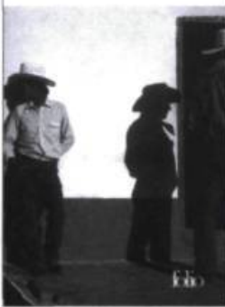
Mario Vargas Llosa La ville et les chiens

nir au pacte de lecture et se souvenir que l'apparence de réel, chez Poulin, chez Aquin ou chez d'autres auteurs (comme Maxime-Olivier Moutier ou Michel Tremblay qui font l'objet d'autres articles dans ce dossier), est un procédé efficace puisque, se posant la question du vrai et du faux, le lecteur accepte le pacte et prend pleinement conscience de sa participation à un univers fictif. La psychocritique pourrait peut-être faire ses choux gras d'une telle identité entre l'auteur et son personnage, mais il n'est pas sûr que la littérature y gagne quelque chose.