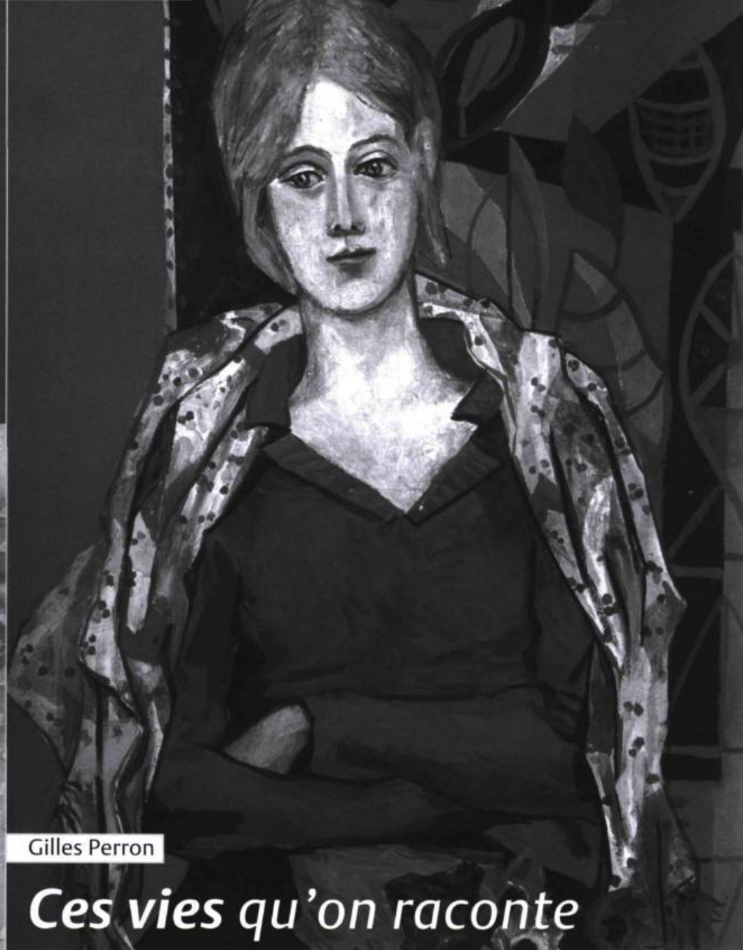
Alfred Pellin, Jeune fille aux anémones , v. 1933. Musée des beaux-arts du Canada, Ottawa.