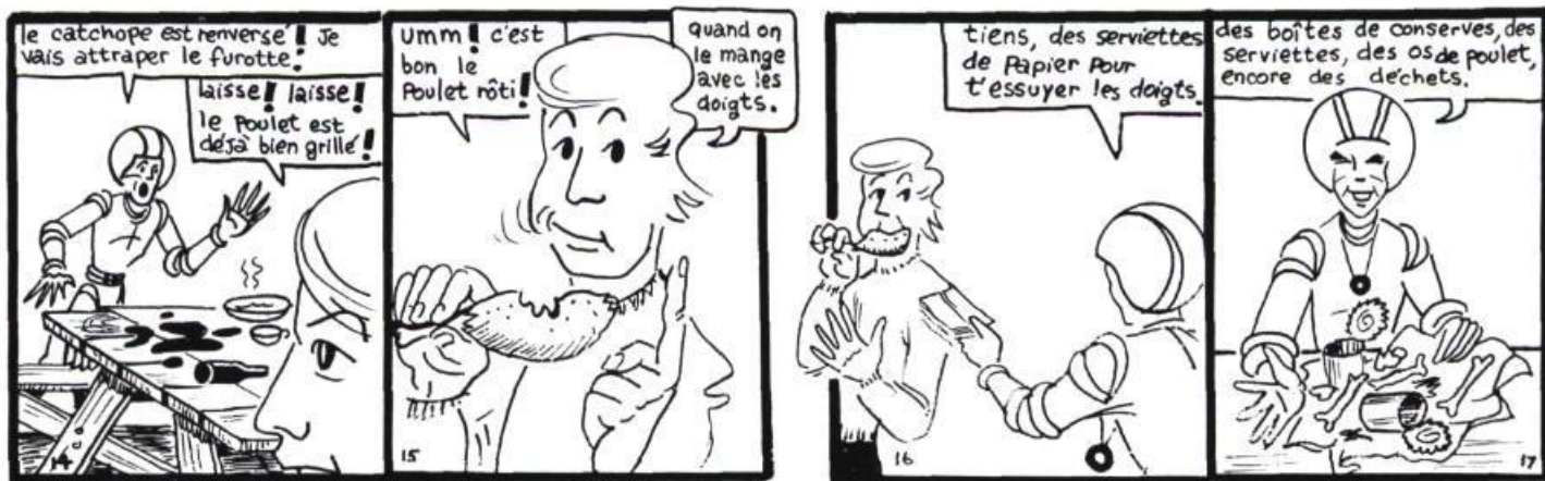
Bande d'accompagnement des Oraliens . Les dessins sont de Pierre Dupras.

Cette insouciance contraste avec la démarche plus rigoureuse et plus «rentable» pratiquée par nos voisins américains dans une situation similaire.