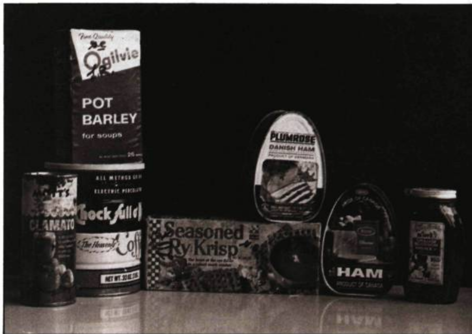
Quelques échantillons des produits dénoncés.