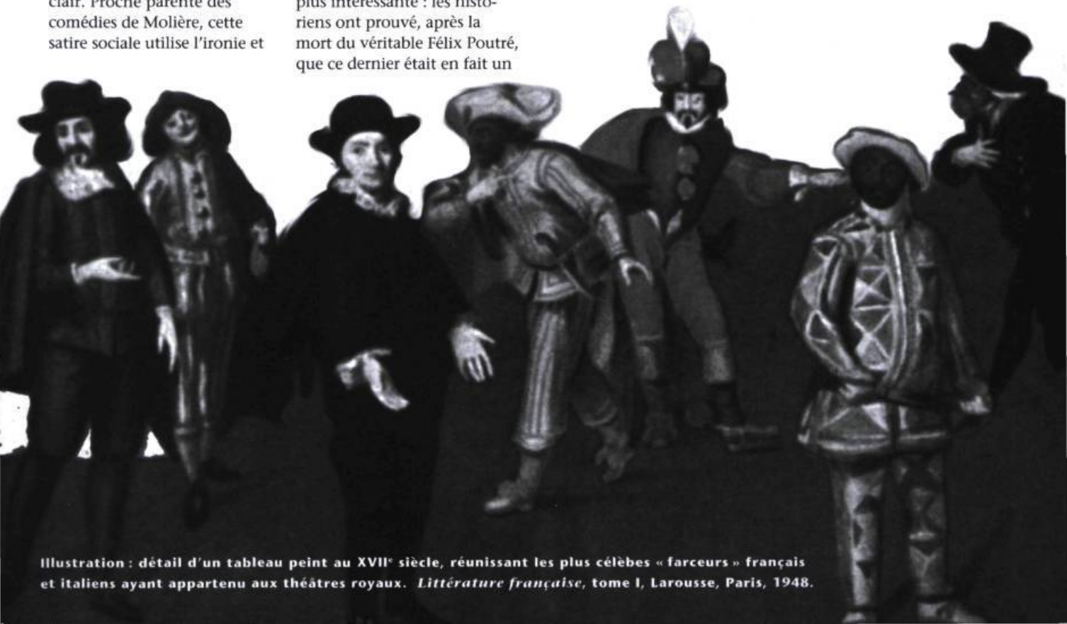
Illustration : détail d'un tableau peint au XVII e siècle, réunissant les plus célèbres « farceurs » français et italiens ayant appartenu aux théâtres royaux. Littérature française , tome I, Larousse, Paris, 1948.