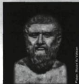
Platon, Musée de Vatican