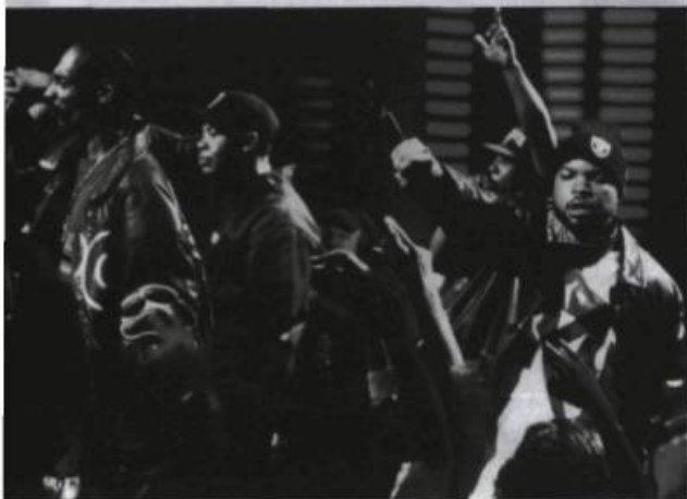
Snoop Dogg, Dr. Dre, MC Ren and Ice Cube... (Rolling Stone, janvier 2001)