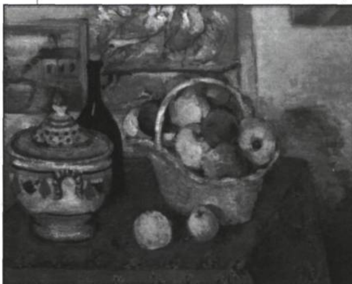
Paul Cézanne, Nature morte à la soupière (détail), vers 1877 (Paris, Musée D'Orsay.)