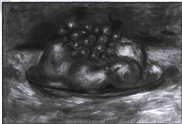
Renoir, Nature morte , vers 1910 (Alger, collection Lopez).

Deux reproductions de natures mortes ou plus, en couleurs. Gouache, pinceaux et cartons. Différentes circulaires de supermarchés.