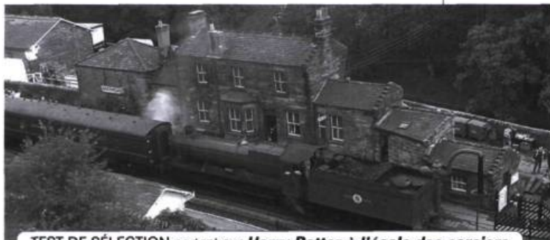
TEST DE SÉLECTION portant sur Harry Potter à l'école des sorciers

Deuxième partie : Jeu questionnaire en direct à l'auditorium : le jeu se déroule à l'image du jeu télévisé Génies en herbe . Après une brève introduction, le jeu débute. Les questions lues par l'animateur sont projetées sur un grand écran derrière les participants, hors de leur vue, à l'usage des spectateurs. Les juges tiennent compte du pointage, dont ils révèlent le total deux fois pendant le jeu et une fois à la fin de la partie. Les prix de participation sont distribués à tous les participants (certificats cadeaux et objets thématiques sur Harry Potter, dont des statuettes, des ap- puie-livres, des bibelots).