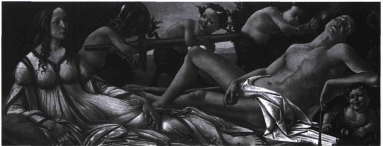
Vénus et Mars, Botticelli, vers 1485-86. National Gallery, Londres.