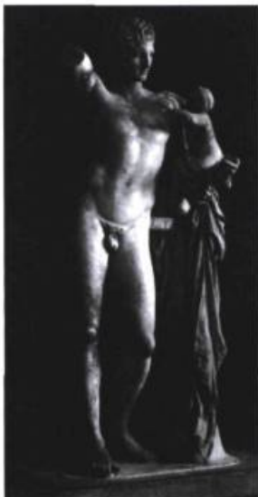
Hermès et les Dioscures, Praxitèle 330 av. J.-C. Musée d'Olympie

De notre jeudi 1 hebdomadaire aux mouvements de la planète Saturne, des potions aphrodisiaques 2 aux hermaphrodites 3 , du narcisse 4 au tournesol 5 en passant par les « boîte de Pandore 6 », « supplice de Tantale 7 », « bras de Morphée 8 » et « talon d'Achille 9 », la mythologie gréco-romaine est depuis fort longtemps — et, sans vouloir faire office de pythonisse, pour quelques siècles encore — partie intégrante de la culture occidentale. Médecine, peinture, astronomie, botanique, vulcanologie, cinéma, séries télévisuelles ou sculpture, autant de champs de savoirs et de domaines artistiques qui se nourrissent au quotidien de l'immense et fabuleux héritage gréco-romain. D'où l'intérêt de considérer, dans nos cursus scolaires, l'importance de ce fonds. D'où l'ex-