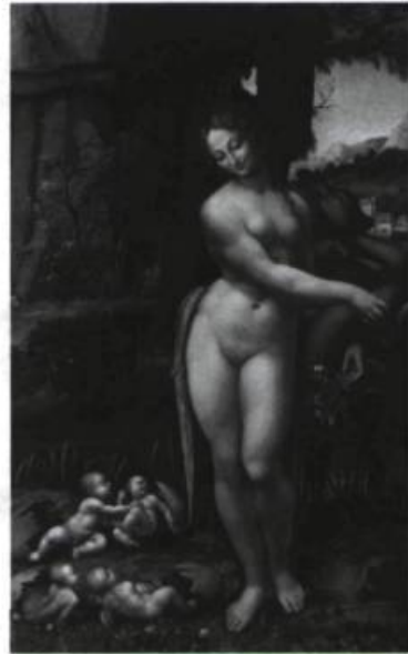
Cesare Da Sesto. D'après Léonard de Vinci. Lédà. Londres, Wilton House.

C'est que, et j'en viens ici à une autre dimension trop souvent ignorée, ancrée dans un système de pensée éminemment subjectif (le plus souvent celui de son auteur), la version d'un mythe a rarement fait l'unanimité de sa société d'accueil. Autre accroc dans une matière que l'on voudrait parfois immatérielle et quasi sacrée, les théogonies, cosmogonies et autres mises en scène des dieux brodées par Homère, Hésiode ou Ovide n'ont pas toujours satisfait les esprits de leur temps. Il faut dire qu'à la lecture de la Théogonie ou des Métamorphoses , on se surprend souvent à sourire de ces dieux et déesses aux défauts bien humains. Ainsi Jupiter, maître de l'Olympe et détenteur de la foudre, semble passer la majeure partie de son immortalité à courir la « nymphette » et à imaginer des stratagèmes pour dissimuler ses multiples adultères aux yeux de Junon, épouse trompée et crainte 14 . Pallas, déesse de la sagesse, succombe à la colère dans le concours livré contre Arachné ; et Phébus, maître des oracles pythiques, est aveugle au destin de son fils Phaéton. Le langage de ces augustes personnages produit également un effet étrange : une relecture récente de l' Illiade m'a étonnée par le nombre de volées de bois vert litté-