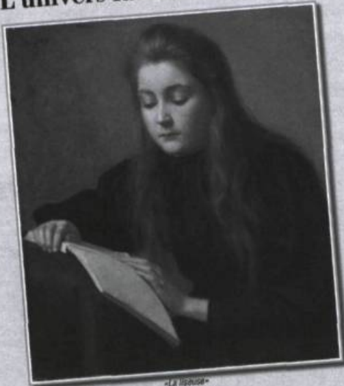
« La Reine » Ozias Leduc

La revue d'histoire du Québec Cap-aux-Diamants consacre son édition automnale à l'univers fascinant du livre. Vous pourrez lire des textes sur les bibliothèques (entre censure et culture), l'essor de l'édition littéraire au XX e siècle, l'imprimerie, la reliure, la Bibliothèque nationale, de même que l'état de la recherche sur l'histoire de l'imprimé.