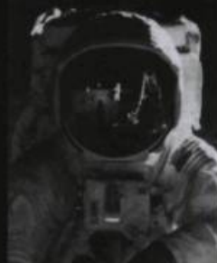
PREMIER HOMME SUR LA LUNE