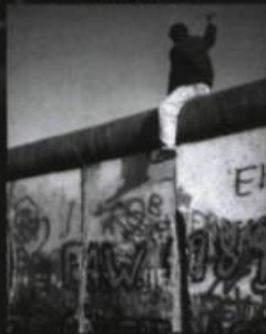
CHUTE DU MUR DE BERLIN