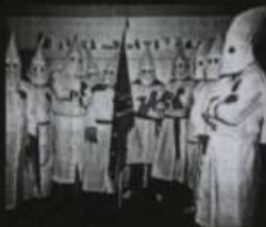
KU KLUX KLAN