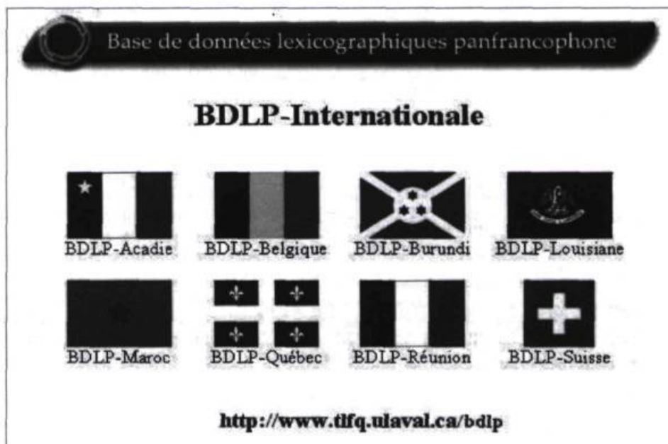
FIGURE 1 Pays ou régions représentés actuellement dans la BDLP

La BDLP a été ouverte à la consultation publique le 18 mars 2004, à l'occasion d'une cérémonie officielle qui s'est tenue au Musée de la civilisation, à Québec, sous la présidence de la rectrice de l'Agence universitaire de la Francophonie, madame Michèle