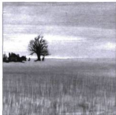
Le coffret Jaune Jean-Pierre Ferland GSI musique, 2005

Il y a 35 déjà, Jean-Pierre Ferland enregistrait son album Jaune , événement majeur dans l'histoire de la chanson québécoise moderne. Les chansons sont connues (« Le petit roi », « Sing sing », « Le chat du Café des artistes », etc.) et se passent évidemment de présentation. Pour ce nouvel anniversaire, GSI musique a eu la bonne idée de proposer les chansons de Ferland dans des habits variés, histoire de voir jusqu'à quel point elles demeurent modernes et incontournables. Le coffret Jaune contient trois disques. Dans le premier, les versions originales côtoient des versions remixées, qui rajeunissent quelque peu la qualité sonore de l'ensemble. Le second est en format DVD, conçu pour une écoute en cinéma maison (avec les versions remixées en stéréo ou en son cinématographique Surround 5 1), les paroles apparaissant à l'écran en même temps que les chansons. Sur le DVD, on peut aussi visualiser un diaporama des photos contenues dans le coffret. Enfin, le troisième disque veut souligner la modernité de l'album original en lui collant un son d'une nouvelle modernité : chacune des chan-