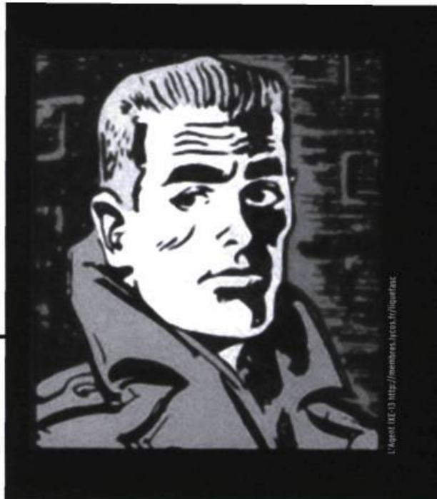
L'Agout (RÉ-13) http://numbers.ircb.fr/iquantec

Les années 1940-1960 sont une période faste pour le polar québécois alors que des milliers de ces récits sont publiés sous forme de fascicules hebdomadaires de 32 pages. En 1944, les éditions Police-Journal lancent la série des aventures de Guy Verchères , l'Arsène Lupin canadien-français . Écrite par Paul Verchères (alias Pierre Daigneault), la série se poursuivra pendant vingt et un ans, avec un total de 937 aventures (54 hors série et 883 numérotées). À la même époque, Félix Métivier proposera Les aventures extraordinaires d'Arsène Lupin en 109 épisodes hebdo-