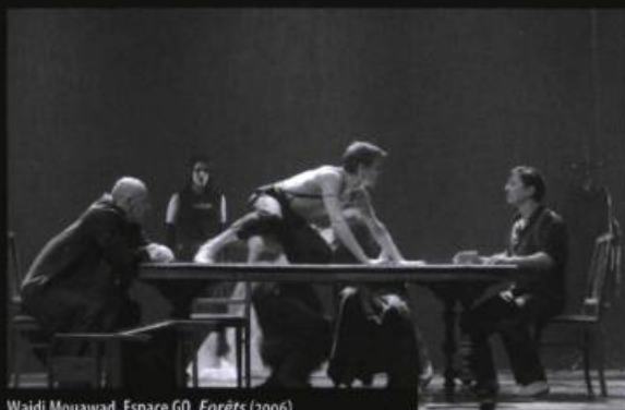
Wajdi Mouawad, Espace G0, Forêts (2006)