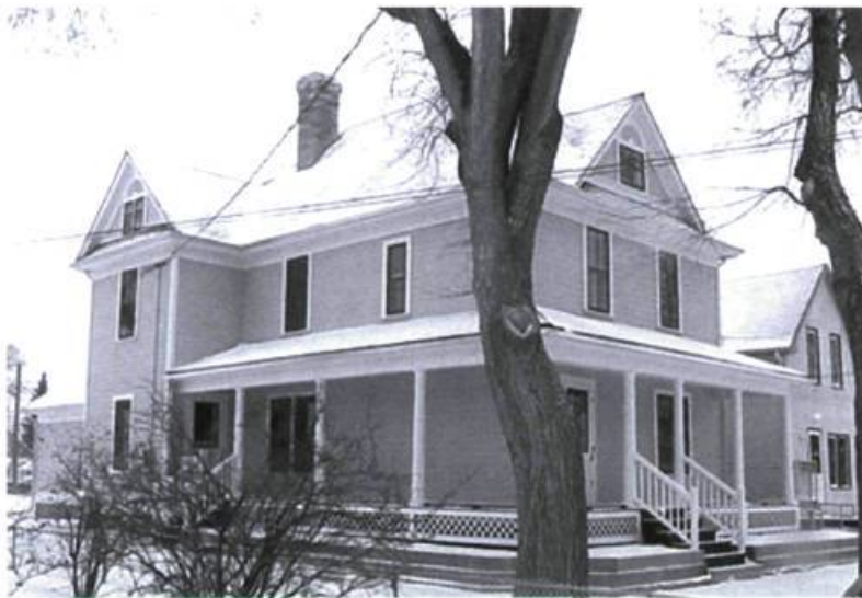
Maison Gabrielle-Roy, rue Deschambault, Saint-Boniface.

Gabrielle Roy commence par rapprocher l'histoire du Titanic et le récit d'une « veillée 1 » à la maison familiale par leurs contextes temporels semblables : la maison dans les « plaines » et le bateau sur l'Atlantique sont aux prises nuitamment avec les rigueurs du climat en saisons froides (« tempête » ou « brume », « froid » et « glace »). Les deux situations et leurs bruits respectifs, « tout près de nous » et « tout proche », évoquent ensuite le « malheur », le « danger », le « mystère » ou la « solitude ». Sans manquer de soulever son caractère antithétique (« continent » / « océan »), le texte explicite assez tôt cette insertion d'une histoire dans une autre : « Mais d'où vient que nos plaines glacées, que nos pauvres plaines gelées ne suffisaient pas à nous donner une assez haute idée de la solitude ! Que pour en parler comme il faut, nous autres, gens enfoncés au plus intérieur du continent, nous évoquions l'océan ! » La maison « en ville » entourée de « plaines » équivaut donc au bateau comparé à « une ville qui s'en allait seule sur les mers ».