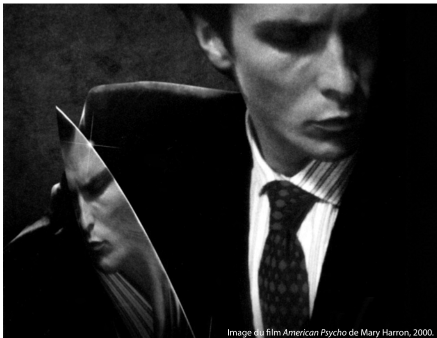
Image du film American Psycho de Mary Harron, 2000.

Le récit s'amorce sur l'instauration d'une ambiance propice à l'inquiétude : « C'était l'un de ces soirs où la banalité semble étendre sa suie partout pour mieux ensevelir vivants les visages du rêve. Aiguillonné par cette