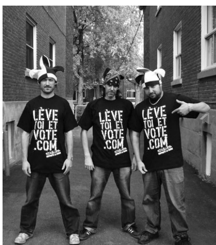
Loco Locass (www.taktika.qc.ca)

Finalement, les élèves placent dans un porte-documents ou dans une reliure à trois anneaux tous les documents reçus et les notes qu'ils ont prises pendant le cours afin de garder des traces de leurs apprentissages. De plus, à la suite de cet atelier, il est souhaitable de leur laisser du temps afin qu'ils puissent écrire dans un journal de bord. Lors de cette activité de métacognition, les élèves font une réflexion personnelle sur leurs apprentissages et notamment sur leur communication orale.