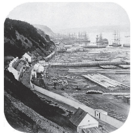
Vue plongeante de l'Anse-au-Foulon vers 1860.

chambre de M sr de Laval, qui administrait cette industrie 5 . Le moulin est rapidement tombé en ruine, mais le nom est resté au lieu-dit ; de plus, un chemin avait été tracé pour accéder au moulin et au fleuve depuis le haut de la falaise ; c'est la côte Gilmour actuelle, ainsi appelée depuis la fin du XIX e siècle du nom de la famille Gilmour, qui fut la principale propriétaire du chantier d'exportation de bois et de construction navale installé dans cette anse. Dans son Histoire du Canada , François-Xavier Garneau parle de la côte du Foulon . Le chemin est mentionné dans des textes écrits en anglais par des officiers ayant participé à la bataille de Québec en 1759 et il est qualifié de « convenient road [...] leading directly from the cove to the camp 6 ». Ces textes parlent aussi de « the Foulon », comme dans cette lettre que le général Wolfe adresse le 12 septembre 1759 à Moncton, qu'il charge de diriger le « débarquement » du lende-