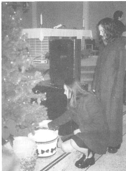
La distribution libre des bonbons bénits le 25 décembre 2003 Paroisse Saint-Jacques, Hanmer, Ontario

Elle prétend que les bonbons bénits, c'est une affaire de foi et que le fait de croire peut guérir bien des maux. Aujourd'hui, les gens ont moins de foi et, comme la pratique des bonbons bénits est directement reliée à la religion, si une génération ne lui accorde pas de valeur, pourquoi la transmettre ? Si un père ou une mère ne respecte plus une tradition, pourquoi l'enraciner dans sa progéniture ?