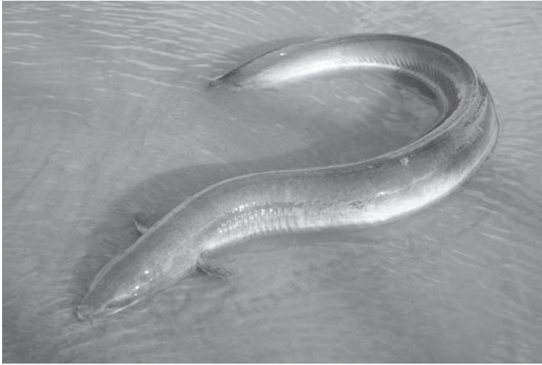
Une anguille d'Amérique [ anguilla rostrata ] appelée aussi anguille argentée