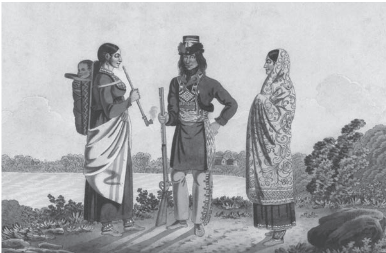
Métis et ses deux femmes Peter Rindisbacher

Encore dans l'Ouest, particulièrement à la rivière Rouge, trois œuvres du jeune peintre suisse Peter Rindisbacher permettent une bonne représentation des ceintures des personnages. Dans A gentleman traveling in a dog cariole at the Hudson's Bay 9 le conducteur porte une large ceinture ; mentionnons ici qu'on ne retrouve pas souvent de telles ceintures sauf dans des fabrications contemporaines appelées W. Dans Métis et ses deux femmes 10 , réalisée en 1822, le Métis porte une ceinture identique à celle de la toile précédente. Dans un troisième tableau, Les Agents de traite de fourrures à la rivière Rouge 11 vers 1821, tous les hommes portent une large ceinture, sans détails. Ces toiles sont fort éloquentes pour témoigner de la présence des ceintures dans l'Ouest. Ce sont maintenant les agents de la Compagnie du Nord-Ouest qui sont présents dans ce territoire.