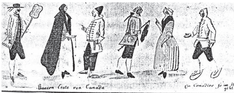
Bauern Leute von Canada [Paysans du Canada]

L'année suivante, soit le 12 avril 1781, James Peachy exécute une aquarelle intitulée Vue des chutes Montmorency en hiver 3 . Nous y voyons trois hommes qui portent une ceinture sur leur capot d'étoffe. Au centre, un homme debout dans un traîneau à cheval, porte sa ceinture. À gauche, l'habitant porte aussi une ceinture ainsi que le conducteur. On voit encore ici l'indication que le