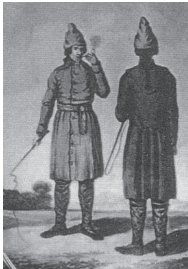
[Habitant portant une ceinture colorée]