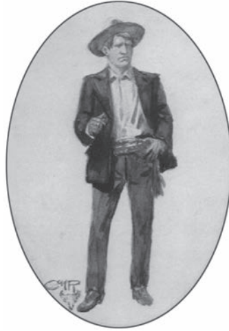
Autoportrait Charles Marion Russell

Grâce à leur bon sens de l'observation, à leur initiative d'inclure dans leurs œuvres la ceinture de laine colorée de l'habitant canadien qui prendra nom de ceinture fléchée, ces 29 artistes nous ont laissé des preuves irréfutables de sa présence. Ce qui permet d'en faire un précieux objet de notre patrimoine. Ils méritent notre reconnaissance.