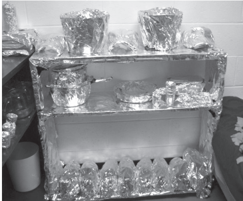
Effets personnels emballés dans du papier aluminium en 2010, dans la chambre d'un étudiant de l'Université Sainte-Anne, à Pointe-de-l'Église, N.-É.

universitaires qui laissent toujours leur porte de chambre débarrée sans souci, dans l'intention de leur faire la leçon, par exemple, en emballant ses effets personnels dans du papier d'aluminium 60 .