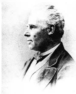
FIGURE 3. William Notman Studio, Sir George-Etienne Cartier , 1871. Albumen print, 14 × 10 cm (Photo: Notman Photographic Archives, McCord Museum, Montréal. n o 67,121).