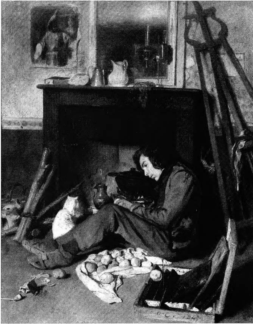
Figure 2. Octave Tassaert, Intérieur d'atelier , 1845, huile sur toile, 46 × 38 cm, Paris, musée du Louvre.

nement physique ou matériel et ne plus l'isoler comme un génie solitaire. D'autres récits ont déjà traité du milieu artistique mais aucun ne semble aussi complet 45 . Dans La Rabouilleuse de Balzac, alors que Joseph exerce le métier d'artiste peintre, c'est Philippe Bridau, son frère, qui demeure le héros de l'histoire ; et si l'auteur détaille quelque peu l'éducation de Joseph, il reste succinct sur ses fréquentations, sa carrière, etc. Par ailleurs, les nouvelles de Balzac sont trop brèves pour faire l'objet d'une analyse détaillée du rôle métonymique de l'atelier comme Le Chef-d'œuvre inconnu , La Maison du chat-qui-pelote , La Bourse , etc. On pourrait également signaler qu'Alexandre Dumas (fils) a publié, dès 1861, avec Affaire Clémenceau – Mémoire de l'accusé , un roman qui met en scène un sculpteur. Mais l'écrivain développe surtout la relation entre les deux amants, Pierre Clémenceau et Iza Dobronowska, qu'au milieu dans lequel l'artiste devrait