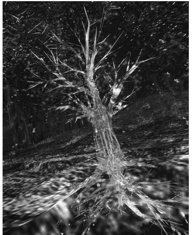
Figure 2. Char Davies, Vertical Tree , Osmose , 1995. Digital still image captured during immersive performance of virtual reality environment Osmose (©Char Davies 2010).

entre une forêt et une clairière virtuelles. Davies opte pour des images élastiques et semi-transparentes, de telle sorte que les limites entre les divers éléments qui constituent le paysage virtuel demeurent floues et baignent dans la lumière. La fluidité de l'espace et des formes évoque une membrane poreuse. Un peu à la manière de ce que saisisrait un regard myope (Davies souffrant elle-même sévèrement de cette affliction), l'espace se constitue en volumes ambigus, contrevenant aux formes définies et aux contours tranchants qui sont ceux de l'illusionnisme et du réalisme photographique. Le dispositif d'exposition prévoit également une pièce munie de deux écrans lumineux, qui est ouverte aux autres visiteurs plongés dans une semi-obscurité. La vidéo stéréoscopique du monde 3D dont l'utilisateur fait l'expérience est alors projetée en temps réel sur l'un des écrans. Le deuxième écran projette la silhouette de l'utilisateur et reproduit, un peu comme une ombre, les mouvements de ce dernier (fig. 1).