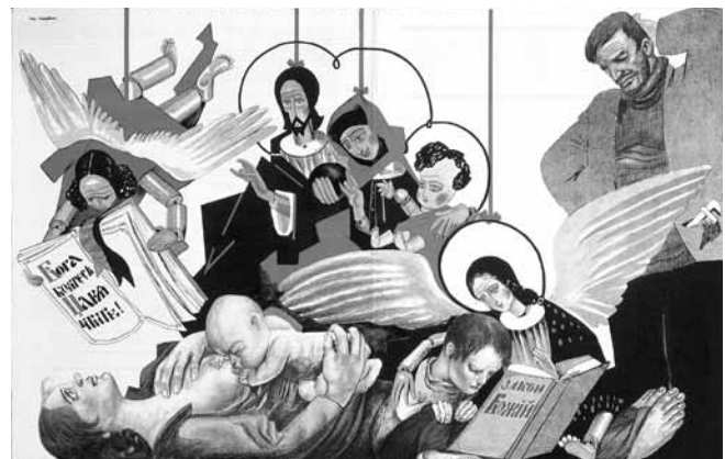
Figure 6. Mikhail Chermnykh, Ma pauvre, ils ont empoisonné ton âme , double page centrale de la revue Bezbozhnik u stanka , no 6, 1923, 36 x 54 cm, Londres, La collection David King.

cadre de nombreuses campagnes subventionnées par l'État, entre autres les campagnes contre la religion, contre l'alcoolisme, contre la prostitution et celles visant la bureaucratisation excessive ou la corruption au sein même du Parti, pour ne nommer que celles-là. Ces campagnes, qui privilégient le mode satirique dans leur propagande, partagent un trait commun : elles visent toutes des problèmes sociaux actuels, considérés comme un legs pernicieux du monde prérévolutionnaire. Le rire sert donc, dans ce contexte, à jeter un éclairage moqueur sur une déviation de la norme idéologique bolchévique ou sur « une imperfection collective qui appelle la correction immédiate », pour reprendre l'expression de Bergson citée plus haut. Comme l'explique Lounatcharski, « Je crois que les "scorpions" de la satire peuvent être dirigés contre le philistinisme, l'étroitesse d'esprit et le bureaucratisme, qui, comme une poussière dans l'air, viennent troubler la respiration saine d'un organisme vigoureux » 43 .