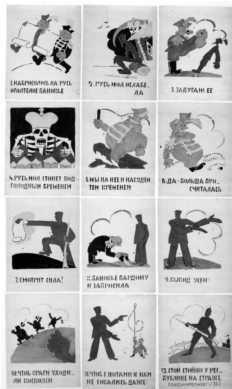
Figure 1. Vladimir Maïakovski, L'aristocratie polonaise se jette sur la Russie , fin septembre ou début octobre 1921, 53 x 42 cm, Jérusalem, Le musée d'Israël.