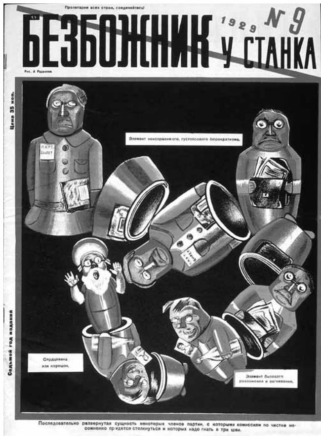
Figure 5. Aleksandr Radakov, La bureaucratie qui s'autogénère, la corruption et la décadence du Parti , couverture de la revue Bezbozhnik u stanka , no 9, 1929, 35 x 25,75 cm, Londres, La collection David King.

cadre de nombreuses campagnes subventionnées par l'État, entre autres les campagnes contre la religion, contre l'alcoolisme, contre la prostitution et celles visant la bureaucratisation excessive ou la corruption au sein même du Parti, pour ne nommer que celles-là. Ces campagnes, qui privilégient le mode satirique dans leur propagande, partagent un trait commun : elles visent toutes des problèmes sociaux actuels, considérés comme un legs pernicieux du monde prérévolutionnaire. Le rire sert donc, dans ce contexte, à jeter un éclairage moqueur sur une déviation de la norme idéologique bolchévique ou sur « une imperfection collective qui appelle la correction immédiate », pour reprendre l'expression de Bergson citée plus haut. Comme l'explique Lounatcharski, « Je crois que les "scorpions" de la satire peuvent être dirigés contre le philistinisme, l'étroitesse d'esprit et le bureaucratisme, qui, comme une poussière dans l'air, viennent troubler la respiration saine d'un organisme vigoureux » 43 .