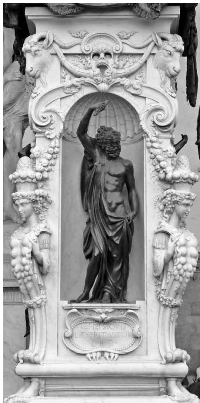
Figure 3. Benvenuto Cellini, copie du piédestal du Persée avec les quatre Artémis d'Éphèse, marbre et étain, hauteur : 199 cm, Florence, Loggia dei Lanzi. L'original, achevé en 1554, se trouve actuellement au Musée du Bargello.

Par ailleurs, si son projet avait été choisi pour le sceau de l'Académie, Cellini, qui était orfèvre, aurait sans doute aussi