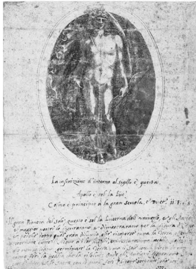
Figure 5. Benvenuto Cellini, Apollon à l'arc , projet pour le sceau de l'Accademia del Disegno, vers 1563, encre et aquarelle sur papier, Munich, Staatliche Graphische Sammlung (no 1147).

Sur le sceau on voit un bel Apollon à l'arc qui ressemble beaucoup à plusieurs dessins attribués à Michel-Ange 53 . Et pour la première fois, dans le commentaire accompagnant le sceau, Cellini précise que le disegno est de deux sortes, le premier étant celui qui se fait dans l'imagination (est-ce la sorte nocturne appartenant à Artémis?). De ce premier disegno est tiré une seconde sorte de disegno , qui « se montre avec des lignes » 54 . Ce disegno des lignes, que Cellini dénigre dans sa dispute avec Bandinelli, a rendu l'homme si « ardent » qu'il s'est mis à rivaliser ( ghareggiare ) avec son père Apollon qui a fait les plantes et l'herbe, les fleurs et les animaux et toutes les merveilleuses