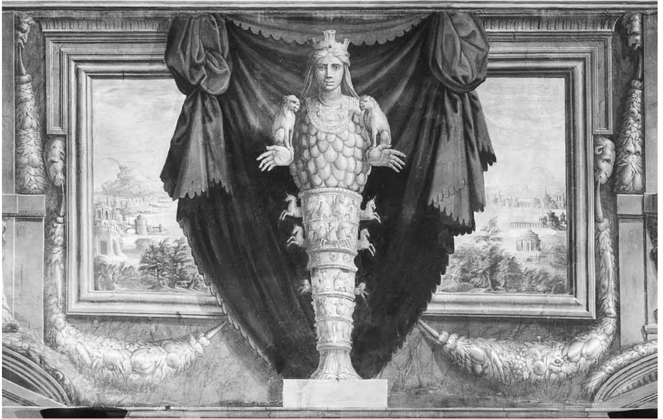
Figure 1. Giorgio Vasari, allégorie de la nature et de la peinture ( Artémis d'Ephèse ), 1548, fresque, Casa Vasari, Arezzo, Italie (crédit photographique : © Ministero per i Beni e le Attività Culturali – Soprintendenza per i Beni Architettonici, Paesaggistici, Storici, Artistici ed Etnoantropologici di Arezzo).

Vasari et Varchi, il emploie le terme d'« arti del disegno », ou arts du design , pour désigner tous les arts plastiques simultanément, emploi qui justifie l'existence d'une Accademia del disegno regroupant tous les arts sous son égide. Cependant l'expression plus moderne d'« arts plastiques » aurait été plus apte à véhiculer les partis pris de Cellini, car pour le sculpteur le problème de ce regroupement résulte de l'ambiguïté du mot disegno , qui peut trop facilement laisser croire que la pratique du dessin, qui est proche de la peinture, est plus importante que celle des autres arts. Cellini est catégorique sur ce point : l'art fondamental est la sculpture, et pour être bon peintre il faut d'abord être bon sculpteur. C'est uniquement parce que Michel-Ange savait sculpter qu'il a pu devenir un peintre de talent 27 .