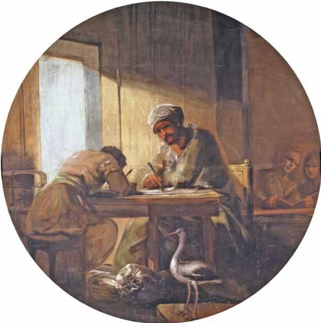
Figure 3. Francisco Goya y Lucientes, Le Commerce , 1801–1805. Détrempe sur toile, 227 cm de diamètre. Madrid, Musée du Prado.

Ce mouvement du commerce international se retrouve accentué dans la page de garde de l'action où une nette division est établie entre la terre à gauche et la mer à droite. Le côté « terre » place le spectateur dans les territoires coloniaux, car il est associé à la représentation du règne animal asiatique : l'éléphant. D'après nous, il est fort probable que l'artiste Cosme Acuña, auteur du dessin de l'estampe, se soit inspiré de la venue en Espagne d'un éléphant au cours de l'année 1773, cadeau du gouverneur des Philippines au roi Charles III 27 (roi fondateur de la Real Compañía de Filipinas ). De plus, l'examen comparé à la loupe de