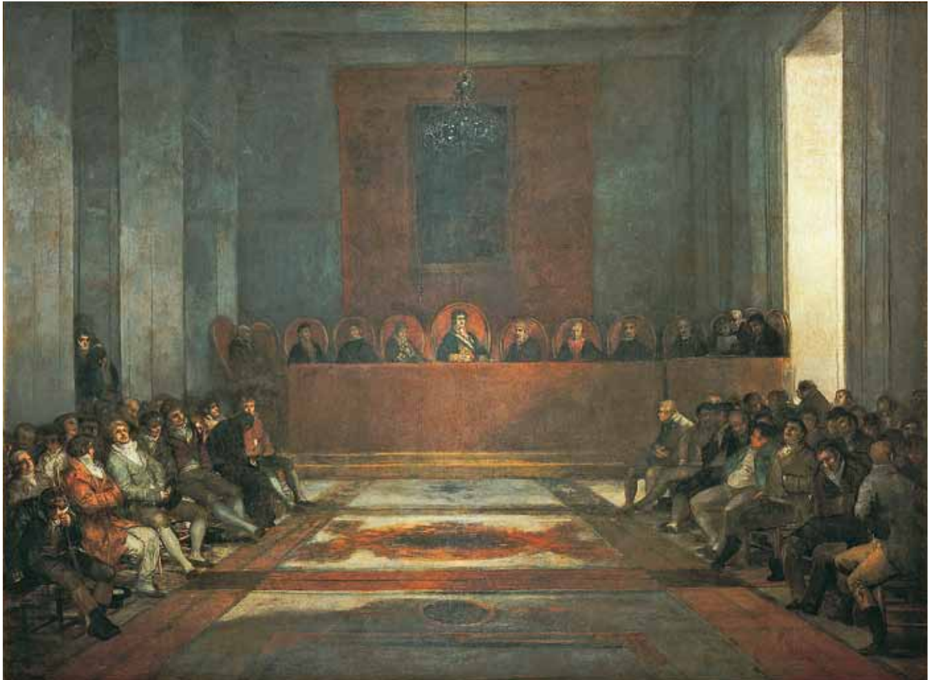
Figure 1. Francisco Goya y Lucientes, La Junte des Philippines , 1815. Huile sur toile, 320,5 x 433,5 cm. Castres, Musée Goya.

orientales » 14 . Sa structure administrative et financière est complexe et se caractérise par une perméabilité entre gestionnaires privés et gestionnaires d'État qu'il ne serait plus possible d'observer de façon aussi prononcée dans les compagnies d'aujourd'hui. Ainsi, le président de la Compagnie des Philippines est le ministre des Indes et le conseil d'administration est entre autres formé d'un représentant des intérêts royaux, d'un représentant de la banque nationale et d'un représentant des intérêts des actionnaires particuliers. Le tableau La Junte des Philippines unit donc des fonctions de représentation du pouvoir politique et du pouvoir économique (les aristocrates et la bourgeoisie, tous deux investisseurs).