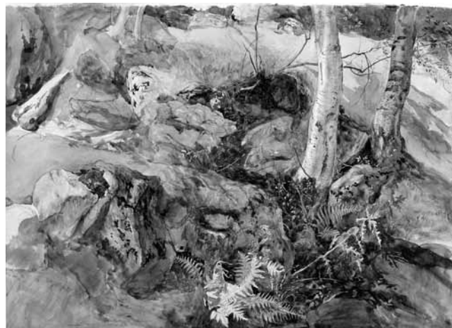
Figure 1. Rocks and Ferns in a Wood at Crossmount, Perthshire 1847 Pen and ink and watercolour over graphite on paper; 32.3 x 46.5 cm Courtesy of Abbot Hall Art Gallery, Lakeland Arts Trust, Kendal, Cumbria, UK (AH1134/73). Reproduced by courtesy of Abbot Hall Art Gallery

For one thing, Ruskin envisioned a substantial project regarding these sketchbooks. Motivated by a belief that learning to draw well means studying expert examples, he assembled close to 1,500 objects for use in the Drawing School that he founded at Oxford in 1871. Comprising prints, photographs, and drawings by a wide range of artists, the collection testified to the expansiveness of Ruskin's interests and seemed